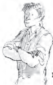
Бащата на Дани