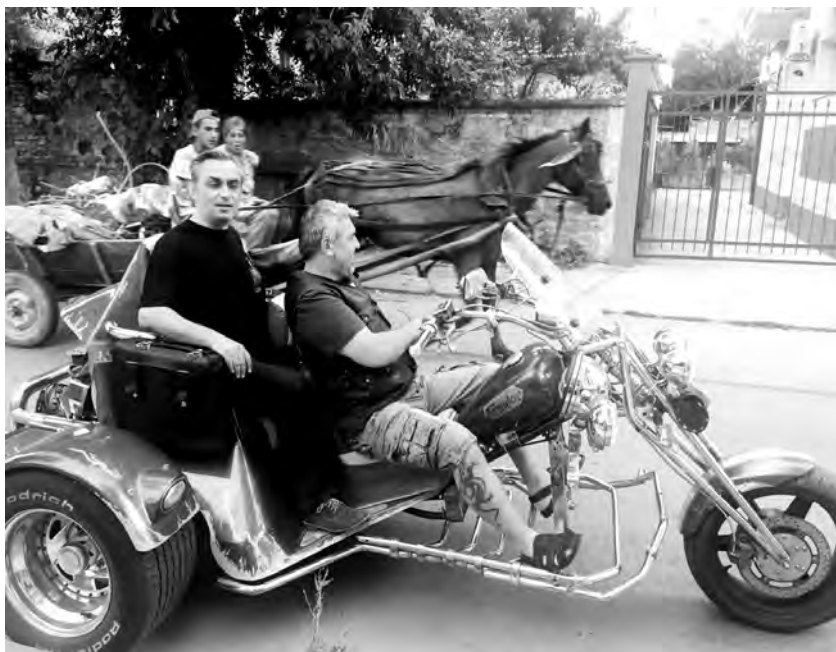
Катунът в акция

кова успешно, но аз също се справих с моята. Разкрих повече подробности около разказаните случки и отговорих на въпроси, свързани с най-новата история на Каварна. Тази, която се пишеше в момента.