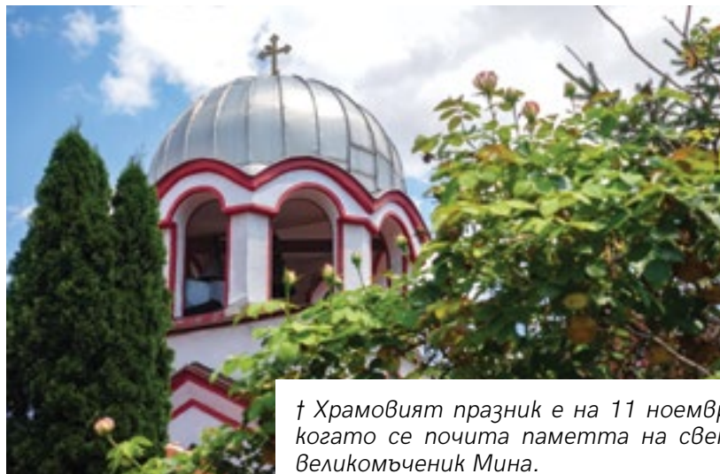
† Храмовият празник е на 11 ноември, когато се почита паметта на свети великомъченик Мина.

През 1970 година започнало строителството на още две сгради със салон, кухня и стая за гости. През 1996 година – още две църкви и две сгради. Мечтата ставала