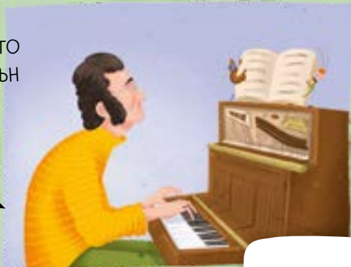
ПИАНОТО НА ЛЕНЪН

Да, наистина! Някои пиана и производителите им са ексцентрични. В началото на ХХI век канадската компания „Хайнцман енд Къмпани“ произвежда суперлюксозното „Хайнцман Кристал Гранд“ пиано, което е изработено от кристал. Далибор жадуваше да посвири на него, но нямаше тази възможност – в целия свят има само един такъв инструмент! Друго знаменито пиано е онова, на което е свирил Джон Ленън от „Бийтълс“. Ленън композирал на този инструмент много световноизвестни песни и толкова го обичал, че го местел със себе си от студио в студио.