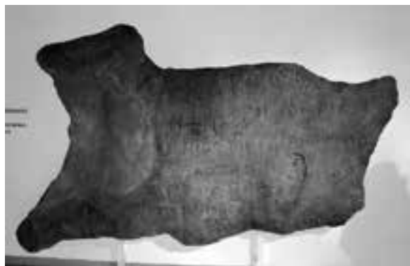
Копие на надписа на севаст Огнян в Националния исторически музей, София. Надписът е открит в Боженишки Урвич край с. Боженица.

Бясна мълния разтърси Боженишкия Урвич, разцепи столетния явор и от него изникна каменна плоча. Надписана от някой си Драгомир, тя гласеше: „Аз, Драгомир, писах. Аз, севаст Огнян, бях при цар Шишман кефалия и много зло патих. В това време турците воюваха. Аз поддържах вратата на Шишмана царя.“ Крепостта стана известна на научните среди през зимата на 1918 - 1919 г., когато в корените на паднало след буря вековно дърво бе разкрит уникален средновековен писмен паметник със заветните думи на управителя на Софийско - севаст Огнян.