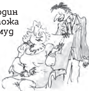
Господин и госпожа Уърмуд