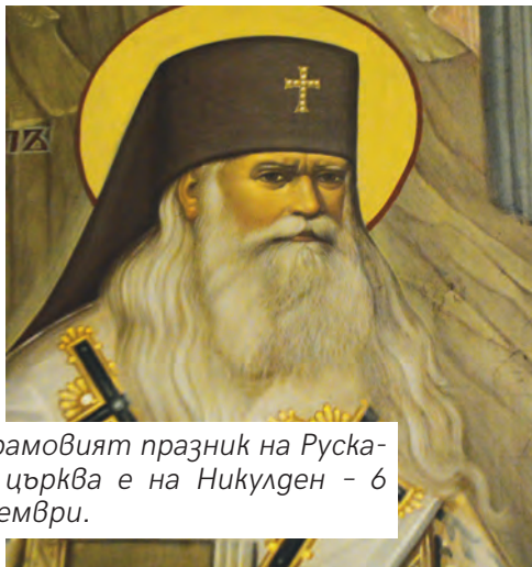
† Храмовият празник на Руската църква е на Никулден - 6 декември.

е тръгнал в правилната посока и че не бива да се отказва.